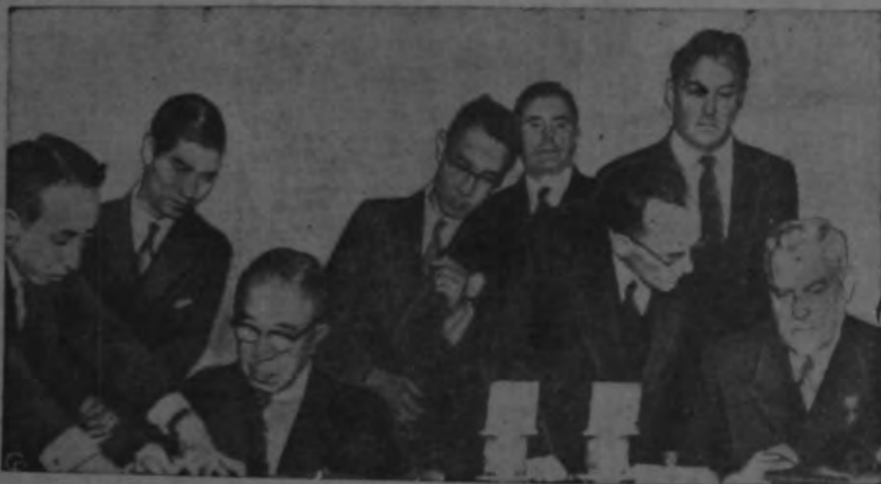
El Premier Soviético Nikolai Bulganin (derecha) y el Premier Japonés Ichiro Hatoyama (izquierda) con sus auxiliares en Moscú al firmar el tratado que puso fin al estado de guerra técnico que países y restableciendo las relaciones diplomáticas, se ha mantenido durante once años entre los dos