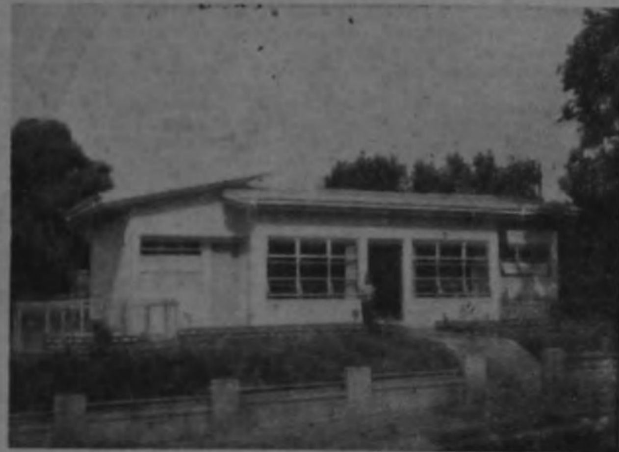
UNIDAD SANITARIA DE VALVERDE VEGA, construida por el MOP con un costo aproximado de ₡90.000, vino a significar un adelanto positivo para la higiene de esa importante población. El edificio consta de: Salón de Espera, 2 salas de consulta prenatal; 2 salas de consulta del niño sano, sala de enfermería, sala del Inspector Sanitario sala para dentista, laboratorio bodega servicios sanitarios suficientes. La Actual Administración ha construido varias Unidades Sanitarias por medio del Ministerio de Obras Públicas y la colaboración efectiva del Ministerio de Salubridad Pública.

En ediciones próximas daremos los nombres de las personas favorecidas.