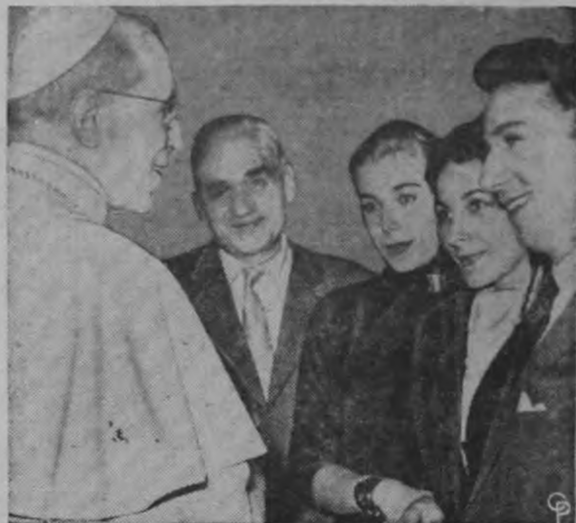
El Papa Pio XII aparece divertido al conversar con los ganadores del premio "Lascia O. Raddoppia" versión italiana de los programas de televisión con premios de dinero de los Estados Unidos. Sonríe a la derecha durante la visita a Castel Gandolfo el maestro de ceremonias Mike Bongiorno. Su auxiliar Campagnol a la izquierda. Las muchachas no fueron identificadas.