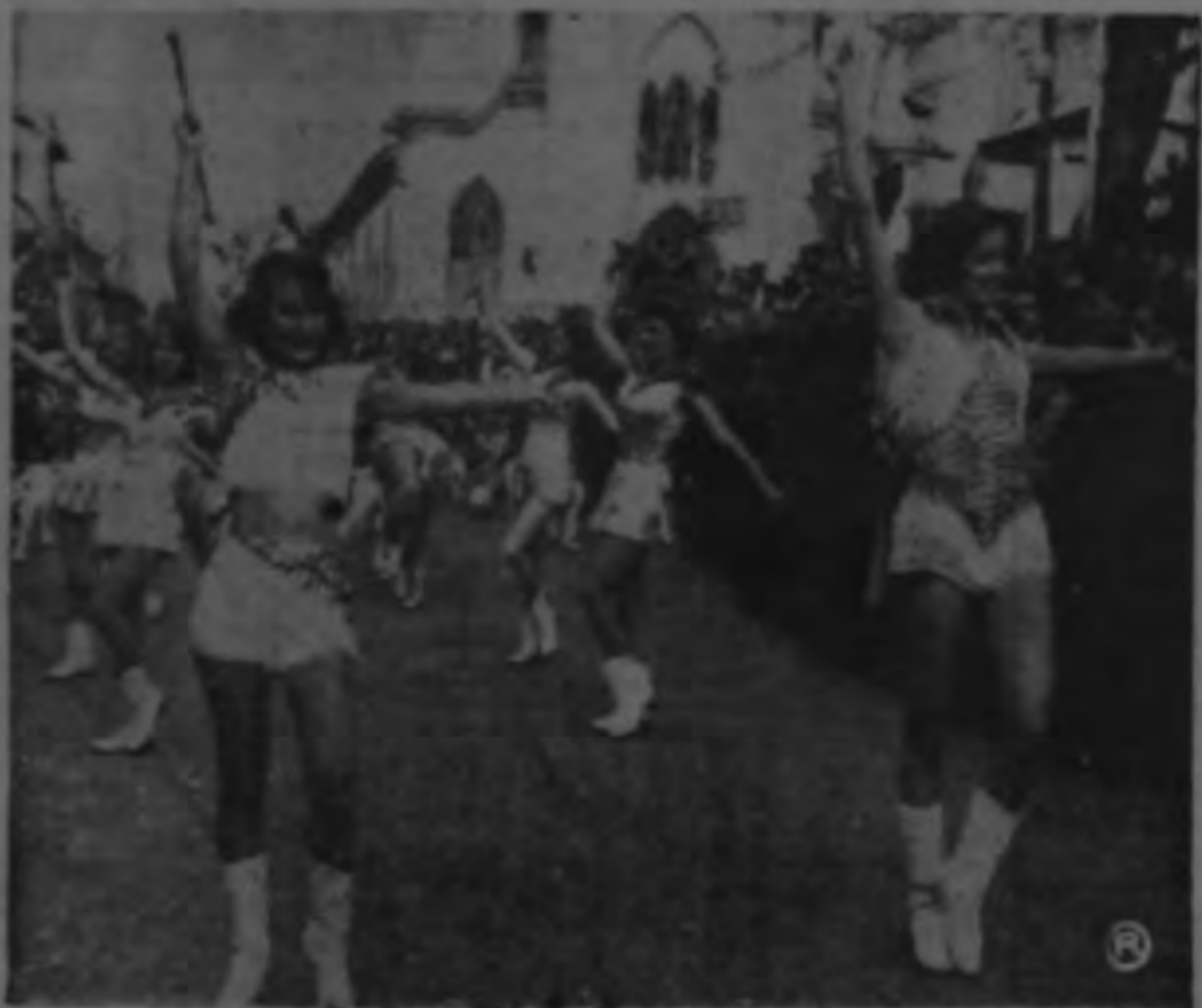
BANDA FEMENINA DE MIAMI EN FIESTAS DE MANIZALES. —En la gráfica aparece la banda femenina de Miami que estará presente en los festivales de Manizales, Colombia, en donde se procederá a elegir a la Reina Continental del Café. Al evento asistirán delegaciones femeninas de todos los países americanos y grupos de arte.